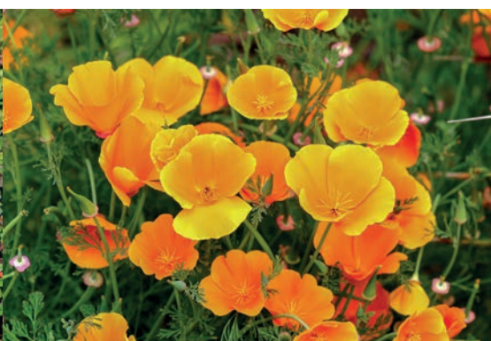
Gelber Mohn