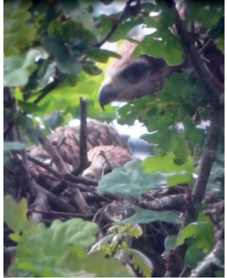
Rotmilan Jungvögel (Erlenhof-Wald Therwil)