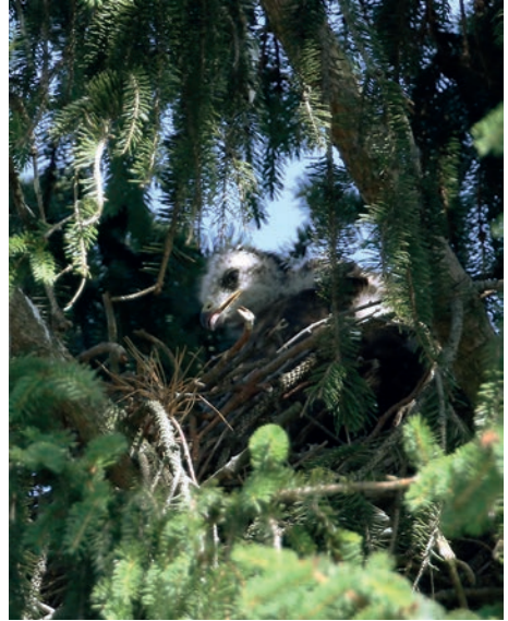
Mäusebussard Jungvogel im Horst (Vogesenstrasse Therwil)

Alle drei Vogelarten kann man heute - zum Teil in grösseren Trupps - bei einer Mahd oder beim Pflügen gut aus der Nähe beobachten. Dort ernähren sie sich von Mäusen, Würmern und Insekten.