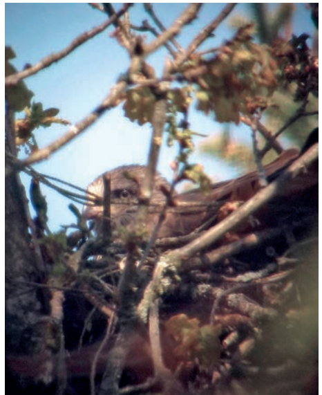
Schwarzmilan Brutvogel (Grüt-Wäldeli Therwil)