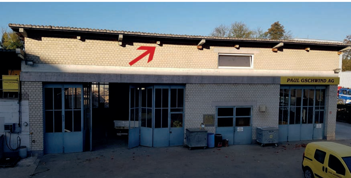
Werkhof Baugeschäft Paul Gschwind AG, Therwil