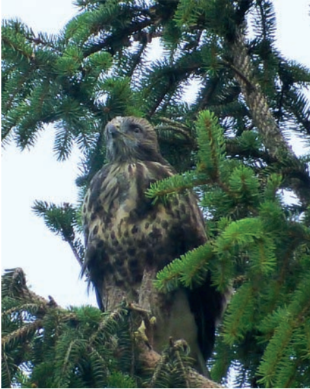
Mäusebussard Jungvogel auf Brutbaum, erkenntlich an sehr heller Unterseite (Vogesenstrasse Therwil)