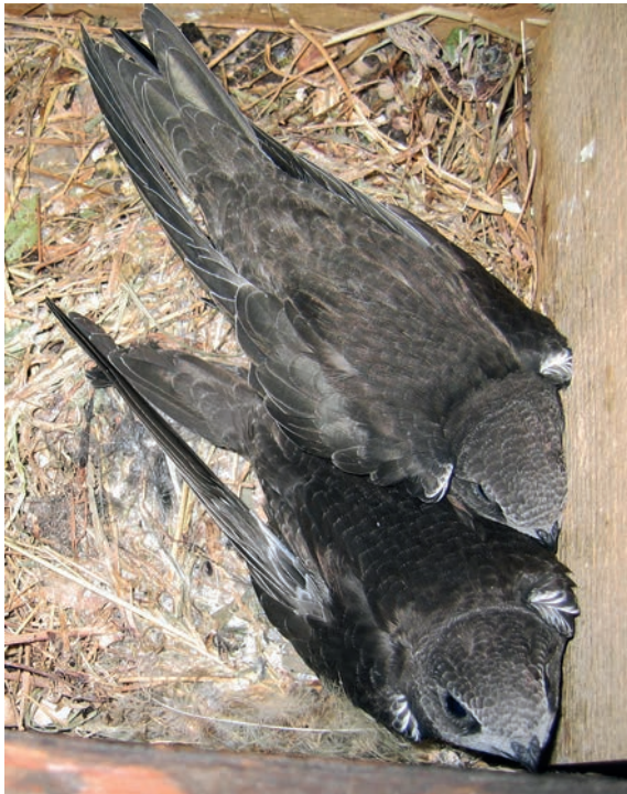
Junge Mauersegler Hinterkirchweg Therwil