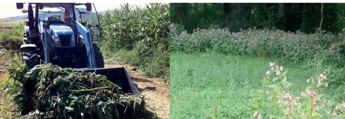
Erste offizielle Naturschutzaktion 2012 Situation Leymengrenze im 2014

Mitglieder des Natur- und Vogelschutzvereins Therwil NVT