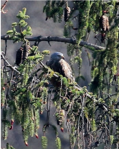
Rotmilan auf Horstbaum (Erlenhof-Wald Therwil)