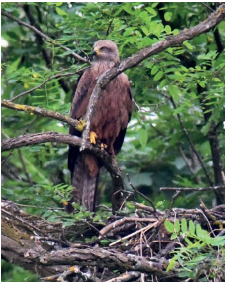
Schwarzmilan Brutpaar (Stutz-Wäldeli Therwil)